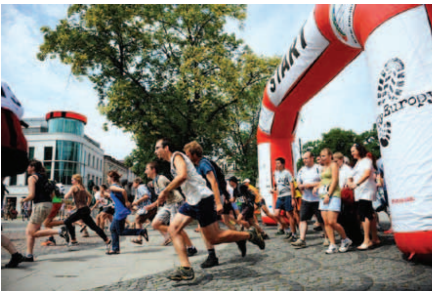
Gra Miejska Tropy Europy

gawczość oraz umiejętności logiczne i taktyczne będą mogli sprawdzić w Warszawie, Ciechanowie i Siedlcach. Z pewnością czeka na nich wiele niespodzianek!