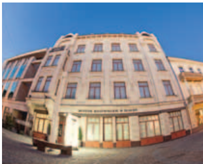
Konkurs Perty Mazowsza

Działania informacyjno-promocyjne prowadzone będą też w gminach i powiatach Mazowsza. Przedsięwzięciem, które ma zagwarantować dotarcie do największej liczby osób w terenie, będzie kampania objazdowa Mazowieckie Centrum Informacji . W ramach MCI prowadzone będą m.in. konsultacje i porady dla dorosłych, konkursy dla dzieci oraz pokaz filmów promocyjnych. Aby lepiej poznać swój region, a zwłaszcza zabytki i inne ciekawe miejsca, które zostały odrestaurowane dzięki środkom RPO WM, można będzie wziąć udział w organizowanym po raz drugi konkursie fotograficznym Perty Mazowsza . Dla spragnionych większych wyzwań i mocniejszych wrażeń zostanie zorganizowana II edycja cyklu gier miejskich – Tropy Europy . Na tropie przygody! Uczestnicy zabawy swoją wiedzę, spostrze-